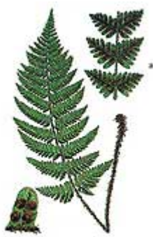
a.- Fragmento del tallo de la lámina con soros b.- porción de una pinnula con soros