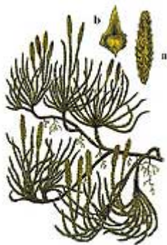
a.- estrobilo (cono) b.- esporófilo con esporangio