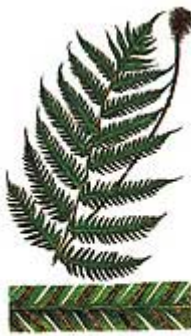
a. detalle del crecés de la lámina con soros